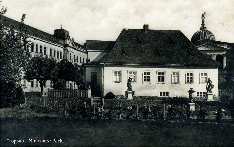
Troppau. Museums - Park.

– Podoba Müllerova domu po odkoupení Slezkým zemským muzeem a instalaci barokních soch z Brantic v upraveném zahradním parteru objektu.